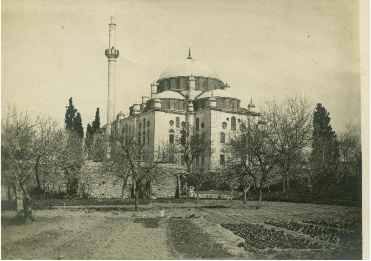
Hekimoğlu Ali Paşa Camii'nin (1734-35) önündeki bostan, 20.yy başı

16. yüzyılda ve özellikle Mimar Sinan'ın yaşadığı dönemde kuyu ve dolap inşa etmek büyük önem kazanmıştır. Mimar Sinan'ın biyografisinde, meşhur mimari eserler bahsinde dolaplı kuyuların nasıl inşa edildiği ayrı bir bölümde anlatılmaktadır. Tezkiretu'l Bunyan'da anlatılan Rüstem Paşa bahçesindeki dolaplı su kuyusunun inşa ediliş süreci bunun bir örneğidir. 7 Böyle bir bahse daha önceki dönemlerde karşılaşmamaktayız. Piyale Paşa külliyesi, İstanbul'daki su yollarından (Kırkçeşme) uzak bir mevkide inşaat edilmiştir. Camii, tekke ve medresenin su tedariki kuyular vasıtasıyla karşılanmıştır. Avluda 3 su kuyusu ve bostanda 1 kuyu ve su havuzu bulunmaktadır. Su tedariki işlevinin dışında bostanlar ve su kuyuları o dönemde inşa edilen dini yapıların ve çevre tasarımının önemli bir unsurudur. Bu anlamda Piyalepaşa Bostanı ve içindeki su kuyusu günümüze ulaşan tek örnektir. Bu nedenle bostana ve kuyuya olası bir müdahale klasik dönem Osmanlı mimarisi araştırmalarını artık imkansız hale getireceği gibi bölgenin tarihsel topografik özelliklerinin son izini de silecektir.